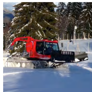
La nouvelle dameuse PistenBully de la station a été réceptionnée mardi